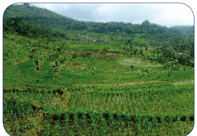
Tanaman padi di Jawa