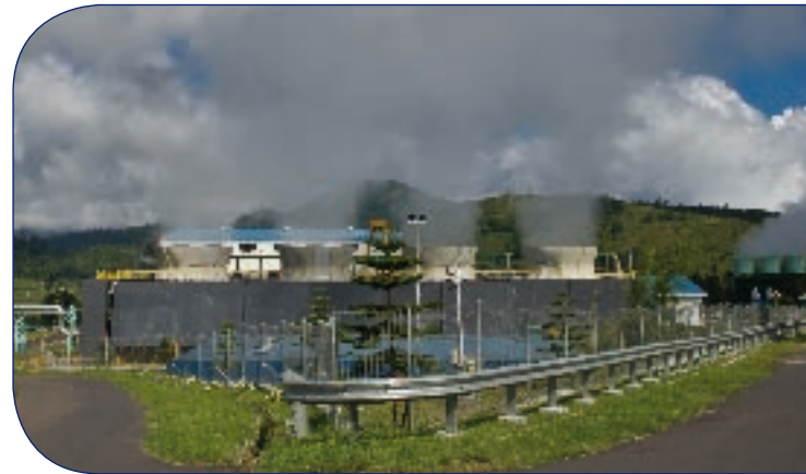
Pusat panas bumi

Dalam kerangka kerja CCPL, AFD juga akan membiayai tenaga ahli kehutanan (dibawah kontrak dengan Pusat Kajian Prancis CIRAD), yang merupakan anggota tim supervise yang bertanggungjawab memantau kemajuan implementasi “ Policy Matrix ” dan mempersiapkan pertemuan-pertemuan Komite Pengarah CCPL.