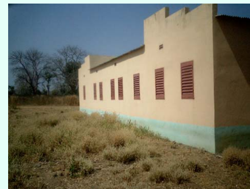
Vue arrière du bâtiment

... mais fermé au public, faute d'équipement