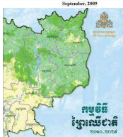
The Cardamom Conundrum