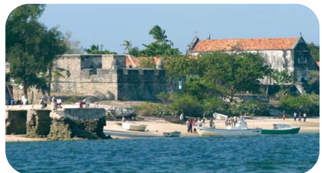
Vue de l'île d'Ibo