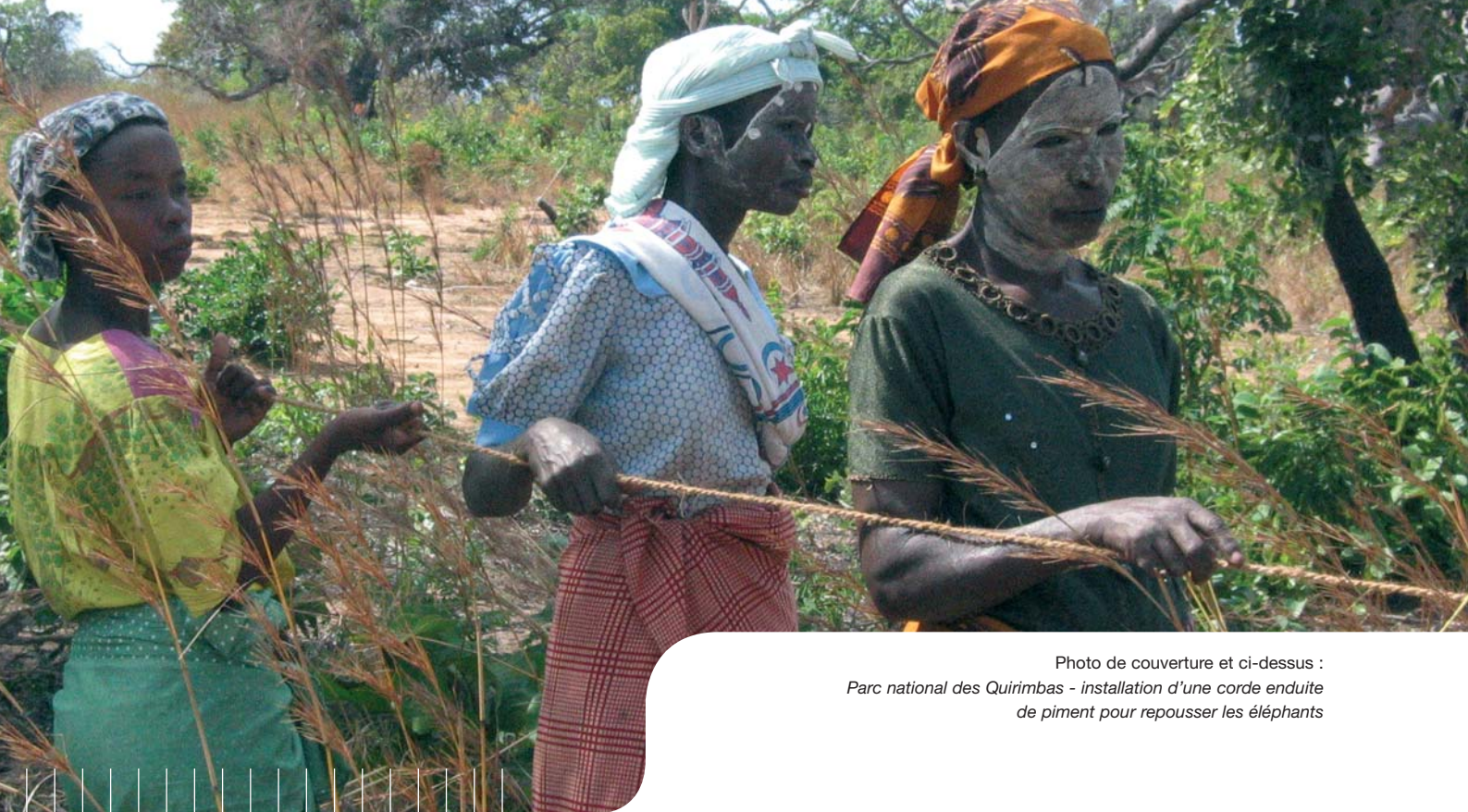
Photo de couverture et ci-dessus : Parc national des Quirimbas - installation d'une corde enduite de piment pour repousser les éléphants

L'Agence Française de Développement (AFD) est un établissement public au service d'une mission d'intérêt général : le financement du développement. Institution financière spécialisée, l'Agence finance dans les cinq continents – avec une primauté à l'Afrique qui représente les deux-tiers de ses engagements - des projets économiques et sociaux portés par les pouvoirs publics locaux, les entreprises publiques ou le secteur privé et associatif.