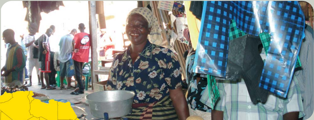
Marché de Maputo - femme bénéficiaire de microcrédit