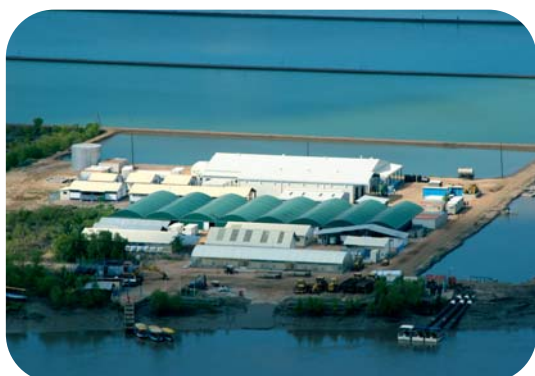
Quélimane - Aquapesca - aquaculture de crevettes

L'action de l'AFD au Mozambique comprend enfin une dimension régionale, par des interventions contribuant à l'amélioration de l'efficacité économique et à l'intégration régionale, comme les parcs nationaux transfrontaliers ou les infrastructures du secteur énergie.