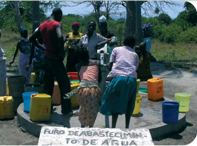
Parc national des Quirimbas - activités communautaires (puits)

Après plus de 15 années de guerre civile, qui ont pris fin en 1992, le Mozambique s'est engagé, avec l'appui de la communauté internationale, dans un vaste programme de reconstruction et de réformes. Cette volonté se traduit par une croissance élevée, de l'ordre de 8 % par an depuis plus de dix ans. La stratégie du gouvernement en matière de développement est définie dans le PARPA (Plan d'Action pour la Réduction de la Pauvreté Absolue). Après les progrès enregistrés par le PARPA 1 (2001 à 2005), qui a permis de faire baisser de 69% en 1997 à 54% en 2003 le pourcentage de la population vivant en dessous du seuil de pauvreté, le PARPA 2 (2006-2009) vise à réduire la pauvreté à 45% en 2009 et à maintenir un taux de croissance élevé (7% par an), grâce notamment au développement du secteur privé. Le PARPA 2 s'articule autour de trois axes de réformes : la gouvernance, le développement humain et le développement économique.