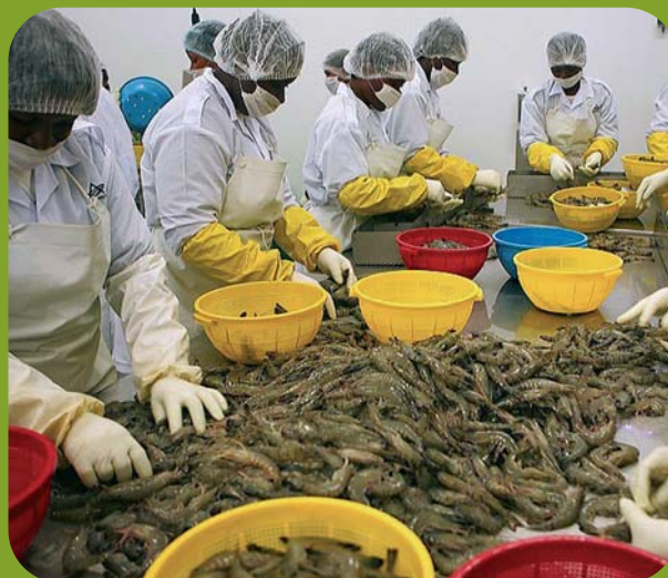
Quélimane - Aquapesca - aquaculture de crevettes