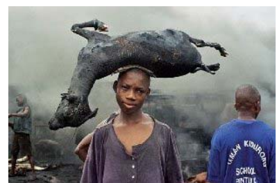
Série Fire, flesh and blood , 2005

Après Bamako, en 2005, Uchechukwu James-Iroha a été largement remarqué lors de l'exposition Snap Judgements à l'ICP de New York, placée sous le commissariat du spécialiste Okwui Enwezor et inaugurée pour le dernier Armory show. « Uche » a également récemment participé à l'exposition Depth of Field à la South London Gallery ou encore aux Voies Off des Rencontres Internationales de la Photographie d'Arles 2006... et il sera l'objet d'une exposition personnelle, pour la première fois en France, du 29 novembre 2006 au 7 janvier 2007, à la galerie Claude Samuel à Paris.