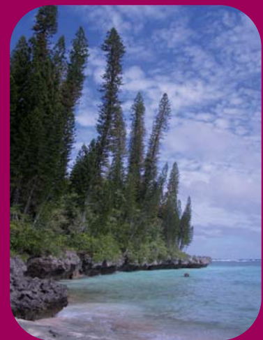
Ile de Maré

L'AFD dispose de procédures internes rigoureuses lui permettant de s'assurer que les enjeux environnementaux sont pris en compte dans l'ensemble des projets qu'elle finance. L'AFD a également noué des partenariats avec l'Agence de l'Environnement et de la Maîtrise de l'Energie (ADEME) et le World Wide Fund for Nature (WWF). Elle contribue financièrement (15 millions USD) au Critical Ecosystem Partnership Fund, géré par Conservation International, dont la vocation est de financer des projets de valorisation économique de la biodiversité.