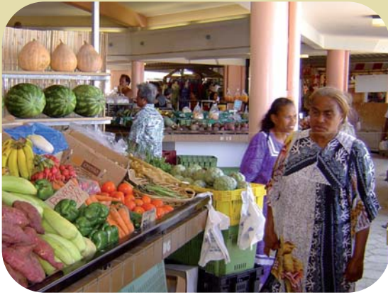
Marché de Nouméa

Engagements cumulés entre 2001 et 2007 en Nouvelle-Calédonie : 80 Milliards de FCFP (c/v 670 millions d'euros)