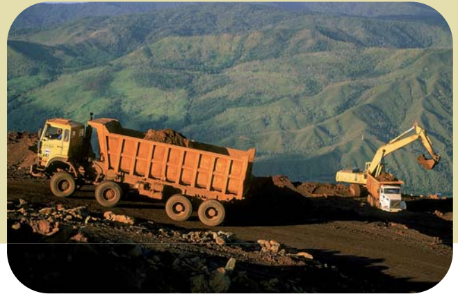
Camion de roulage sur mine