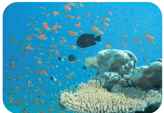
CRISP Acropora-Anthias