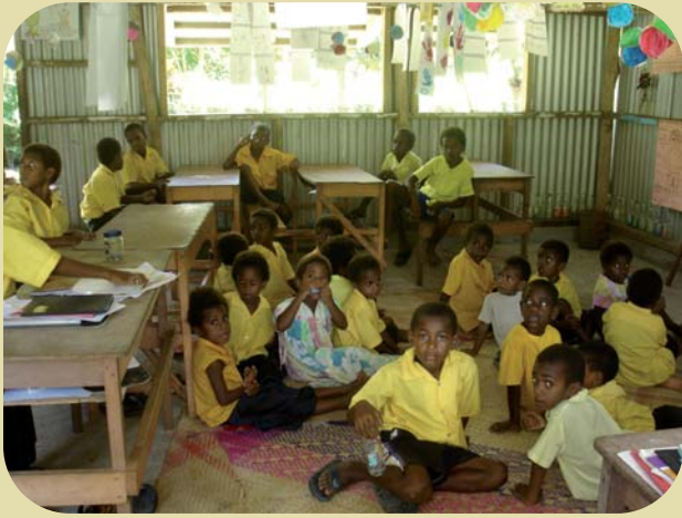
Ecole de Malampa (Port Vila)