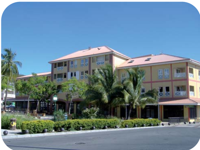
Immeuble Mary réhabilité par la SIC (Nouméa)