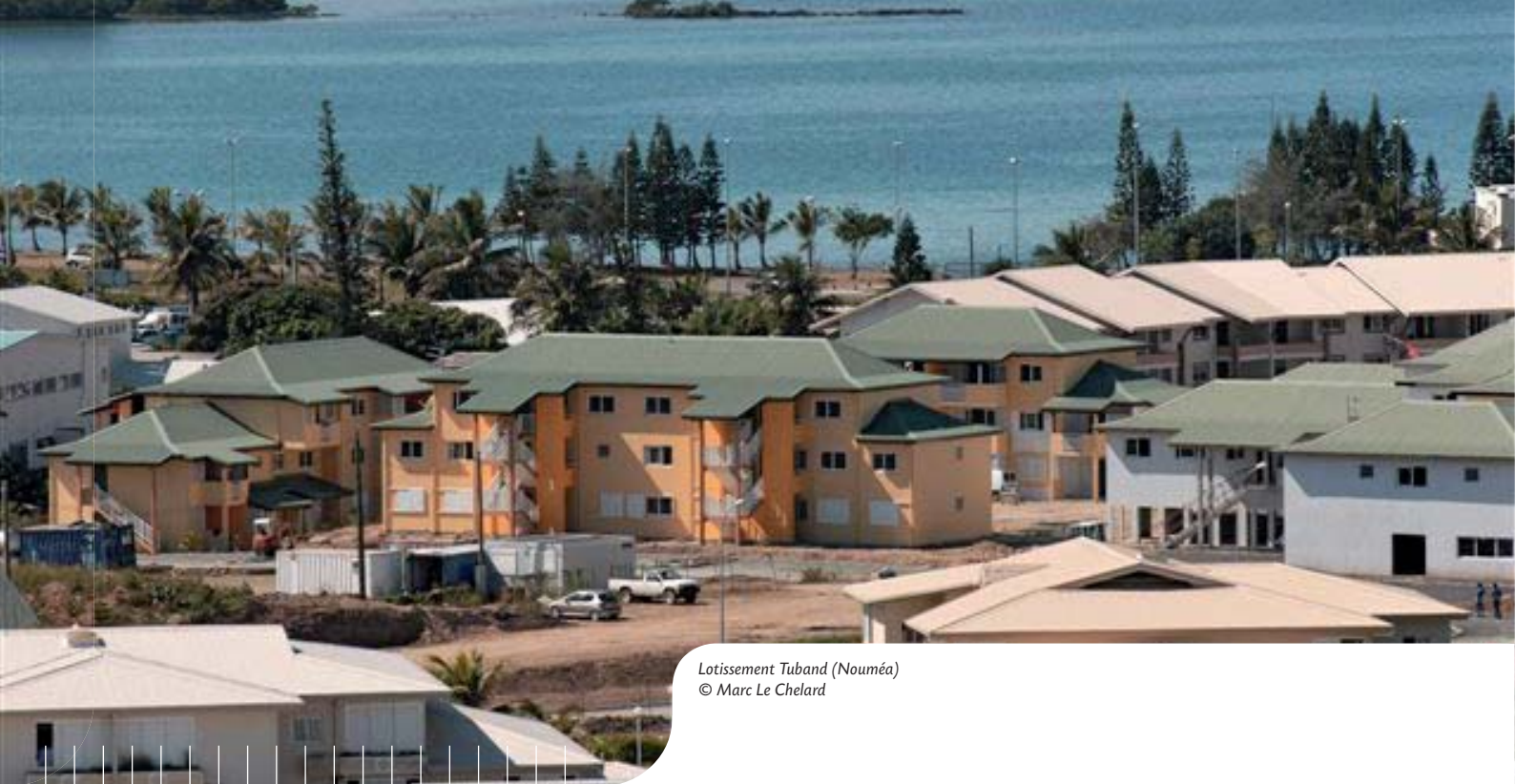
Lotissement Tuband (Nouméa)

L'Agence Française de Développement est un établissement public au service d'une mission d'intérêt général : le financement du développement. Institution financière spécialisée, elle soutient des projets à portée économique et sociale, du secteur public comme du secteur privé : infrastructures et systèmes financiers, développement urbain et rural, éducation et santé.