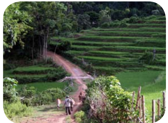
Việc tài trợ cho cơ sở hạ tầng nông thôn có mục đích xóa đói giảm nghèo, đặc biệt là hỗ trợ cho các dân tộc thiểu số.