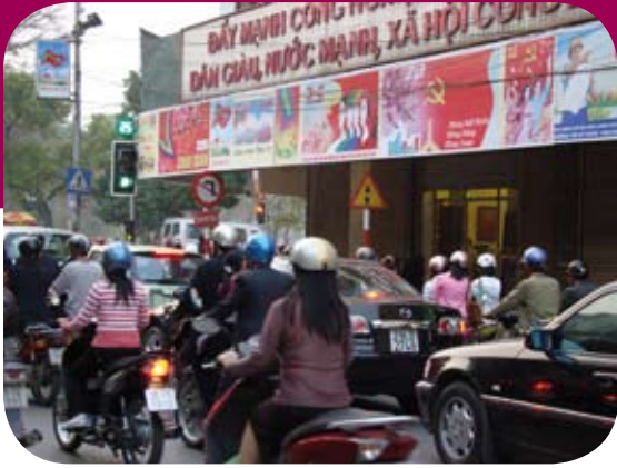
Sự phát triển đô thị đòi hỏi phải có những dịch vụ cơ bản và quản lý các tác động tới môi trường.