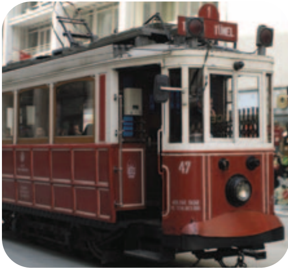
Le tramway historique