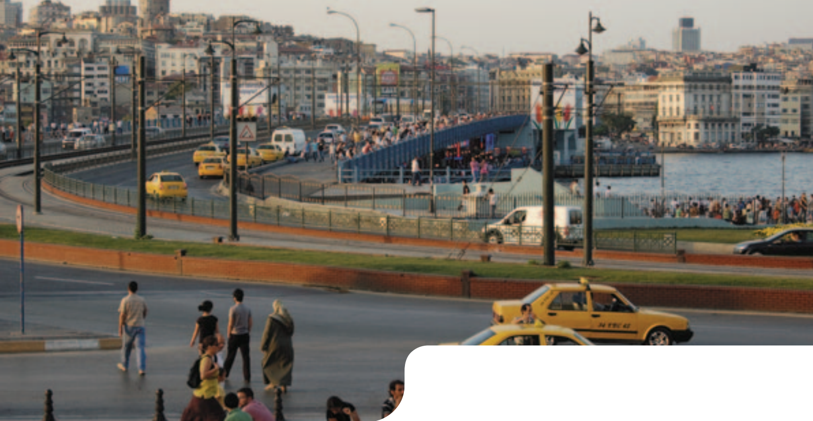
Le pont de Galata

Établissement public dont la mission est définie par le gouvernement français, l'Agence Française de Développement (AFD) agit, depuis plus de soixante ans, pour combattre la pauvreté et favoriser le développement des pays du Sud.