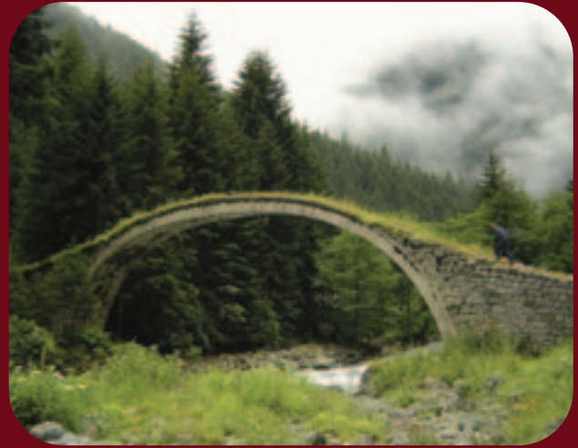
Un pont en région de la Mer Noire