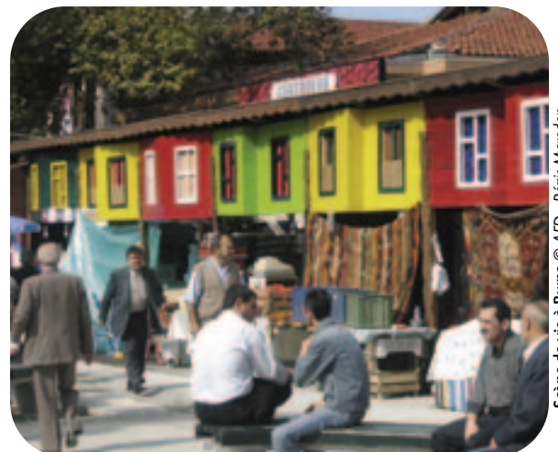
Scène de vie à Bursa