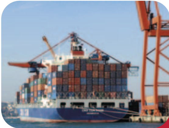
Containers dans le port d'Istanbul

Le 5 février 2009, la Turquie a signé le protocole de Kyoto, qui vise à lutter contre le changement climatique en réduisant les émissions de CO 2 . L'AFD accompagne cette démarche en proposant des financements pour le développement des énergies renouvelables et propres ainsi que la création d'infrastructures (transport, eau et assainissement, déchets ménagers) permettant de réduire l'empreinte carbone du pays. Ce soutien se réalise au travers de projets portés par des partenaires bancaires turcs (TSKB, Garanti, Akbank) qui, le cas échéant, peuvent également bénéficier d'une assistance technique spécialisée.