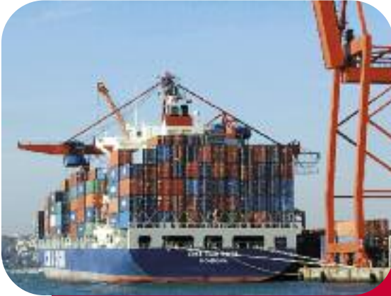
Istanbul Limanındaki Konteynirler

Türkiye, iklim değişikliğine karşı karbon emisyonlarının azaltılmasını öngören Kyoto protokolüne 5 Şubat 2009 tarihinde imza atmıştır. AFD ise atılan bu adıma, ülkenin karbon salınımını azaltacak yenilenebilir, temiz enerji ve altyapı tesislerinin (ulaşım, atık suların arıtılması ve katı atıkların işlenmesi), kurulması için fon sağlayarak destek olmaktadır. Bu destek, AFD'nin ortak çalıştığı bankalarla birlikte proje finansmanı aracılığıyla (TSKB, Garanti, Akbank) verilmektedir. Bankalar aynı zamanda, özel teknik danışmandan da faydalanabilmektedirler.