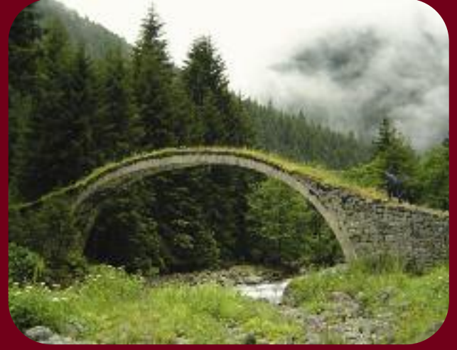
Karadeniz Bölgesinde bir geçit resmi