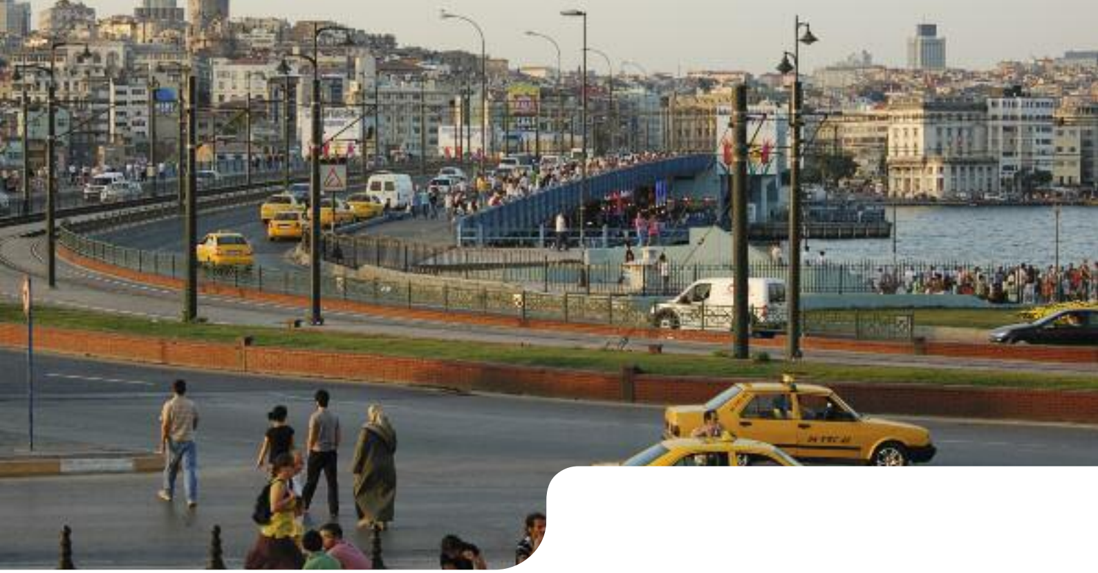
Galata Köprüsü

Kamu kuruluşu olan L'Agence Française de Développement, 60 yıldan fazla bir süredir Fransa Hükümeti tarafından kendisine tanımlanan görevler çerçevesinde yoksullukla mücadele ve güney ülkelerinin kalkınması için hareket etmektedir.