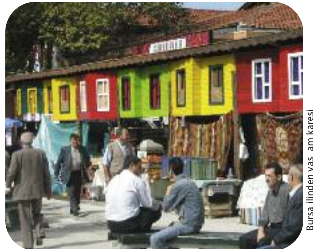
Bursa ilinden yas. am karesi