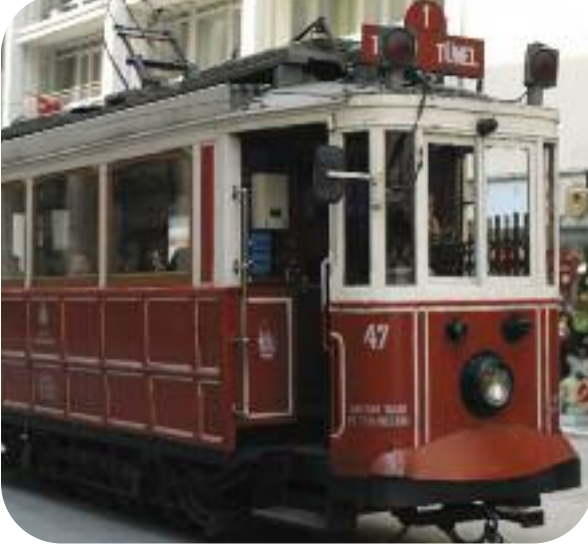
Tarihi Beyoğlu Tramvayı