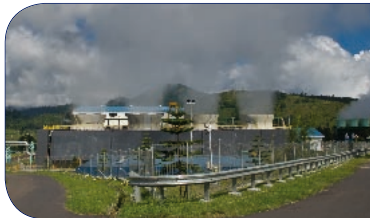
Centrale géothermique