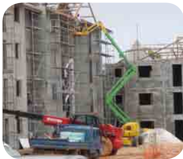
Construction de logements à Cayenne

Microcrédit Guyane Adie fait partie du réseau national des agences de l'ADIE (Association pour le Droit à l'Initiative Economique), association créée en 1988 en adaptant à la France le principe du microcrédit. Avec son réseau d'antennes et de permanences en Guyane et grâce au soutien de bénévoles et de ses partenaires, comme l'AFD, Microcrédit Guyane Adie aide les personnes en difficulté en leur ouvrant l'accès au crédit et en leur apportant la formation et l'accompagnement dont elles ont besoin pour créer leur emploi. Depuis 2004, l'ADIE a financé plus de 400 créateurs d'entreprise en Guyane.