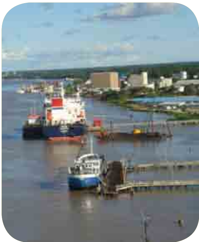
Port de Paramaribo (Suriname)

L'AFD assure en Guyane la représentation du Crédit Foncier de France et gère à ce titre un portefeuille d'environ 750 prêts représentant un encours de l'ordre de 16 millions d'euros fin 2008.