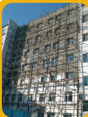
Isolation thermique à Heihe, Heilongjiang