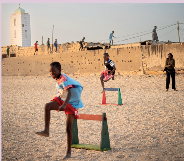
ASSCAN - © David Blough

(2 quartiers) ; et enfin la conception et mise en œuvre d'une formation pour les éducatrices et enseignants en collaboration avec l'université (Certificat en Compétences d'Animation Socio-Éducative et Populaire).