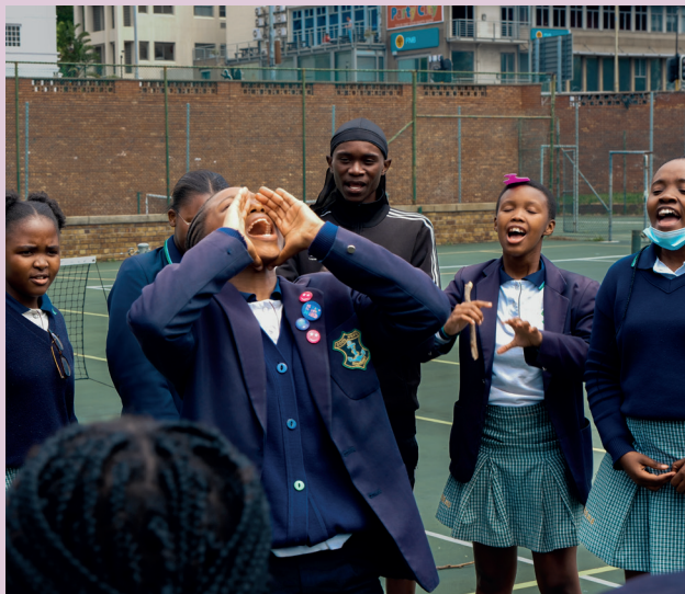
School of Hard Knocks

Fondée en 2009, The School of Hard Knocks (SOHK) utilise le rugby pour proposer un soutien psychosocial adapté aux jeunes afin qu'ils améliorent leur bien-être et leur santé mentale. Elle place au cœur de son action le fait de favoriser une évolution positive de l'égalité femmes-hommes. L'association fait partie d'un réseau opérant au Royaume-Uni, en Nouvelle-Zélande et en Afrique du Sud. Elle appuie sa démarche sur la construction d'un espace de confiance ( safe space ) entre encadrantes et encadrants et les jeunes. Cette démarche est basée sur des activités de jeux sportifs et coopératifs tout au long de l'année, accompagnés d'ateliers/débats sur l'égalité femmes-hommes, et un accompagnement psychologique individuel des jeunes. Lauréate du programme « Sport & Santé », elle propose, dans la ville du Cap, un