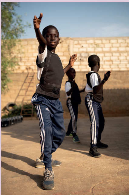
Pour le Sourire d'un Enfant

Fondée en 1989, et basée à Thiès, au Sénégal, l'association utilise une méthode basée sur la pratique et l'apprentissage de l'escrime, afin de favoriser la prévention de la « délinquance juvénile » et la réinsertion des jeunes en prison, en partenariat étroit avec les autorités (justice, prison), les familles et les communautés locales. L'association propose, grâce à un enseignement didactique de l'escrime, d'agir sur cinq notions clés qui empruntent à la fois à la psychologie et à la sociologie : l' identité , dans la mesure où il s'agit de sensibiliser les participants à des notions comme l'estime de soi, la confiance en soi ou encore la prise de décision dans un parcours de vie ; la socialisation , pour aider les publics bénéficiaires à développer les compétences qui faciliteront leur retour en société : la relation à l'autre et à l'autorité, le respect de l'autre et de soi-même, l'adaptation à un contexte changeant ; le contrôle de soi , où il est question de gestion des émotions, de tolérance à la frustration et de l'engagement ; la responsabilité , objectif derrière lequel se cache l'enjeu d'assumer ses décisions et de savoir les justifier et l' acquisition de capacités motrices, techniques et cognitives . Le cœur de la méthode, nourrie par des rencontres et des échanges avec des sociologues, des psychologues et des psychiatres, est d'adapter les exercices de la pratique sportive aux besoins psychosociaux et éducatifs